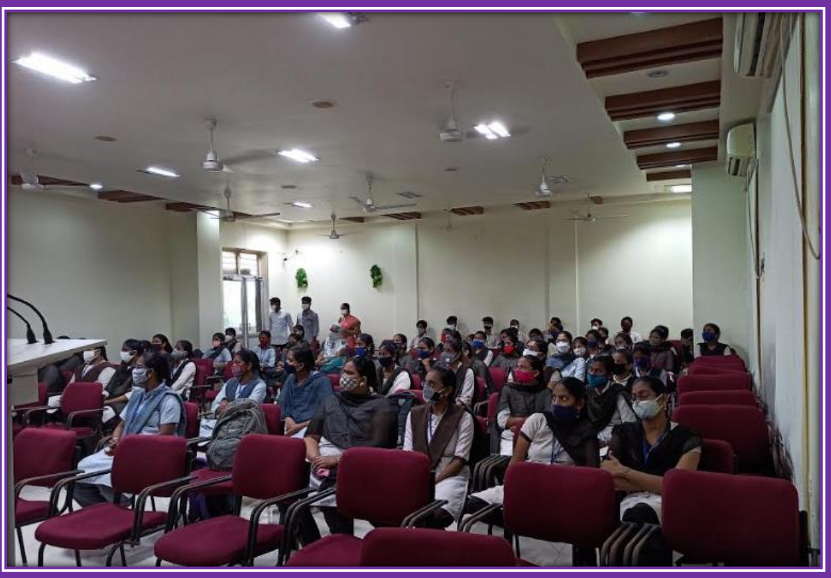
Students at the Programme